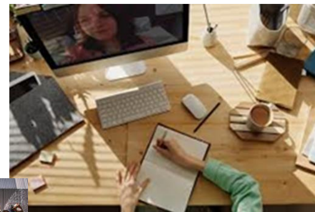
Delphine, IT consultant, 25 jaar Speelt in dezelfde fanfare tijdens haar vrije tijd